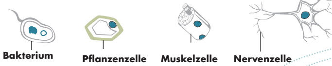
Bakterium Pflanzelle Muskelzelle Nervenzelle

Einzeller wie Bakterien bestehen aus einer einzigen Zelle. Pflanzen, Tiere und Menschen sind Vielzeller. Der menschliche Körper besteht aus Organen wie Herz und Leber. Und die Organe bestehen aus Geweben, die sich aus Zellen zusammensetzen. Neben Wasser bestehen Zellen zum grössten Teil aus Eiweissen, auch Proteine genannt. Es gibt sehr viele Arten von Proteinen. Sie erfüllen in den Zellen und damit letztlich im Körper viele lebenswichtige Aufgaben.